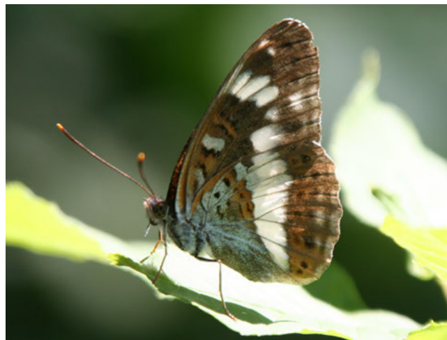
Kleine ijsvogelvinder ( Limenitis camilla )

Maatregelen die de effecten op de plek van handeling herstellen, zijn mitigerend van aard; maatregelen die de effecten voor de populatie opheffen door herstel of verbetering op een andere plek zijn compenserend van aard. Overigens wordt bij soortenbescherming geen scherp onderscheid gemaakt tussen mitigerende en compenserende maatregelen (dit in tegenstelling tot gebiedenbescherming). Belangrijk is dat de staat van instandhouding gegarandeerd wordt.