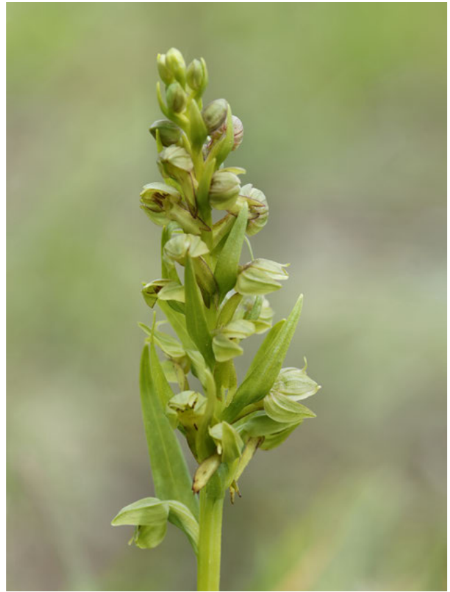
Groene nachtorchis ( Coeloglossum viride )

Om te bepalen of strikt beschermde soorten dan wel hun voortplantings- en rustplaatsen of nesten voorkomen kunt u de hulp inschakelen van een ecologisch deskundige. U kunt ook de Nationale Databank Flora en Fauna raadplegen.