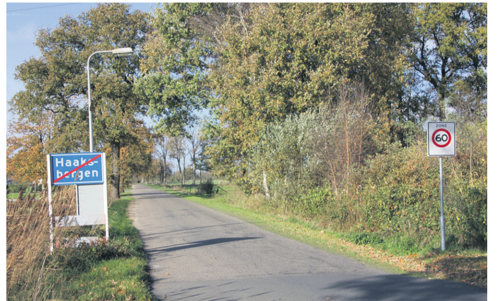
Soms is kavelruil over gemeentegrenzen heen een uitkomst.

De Twente kavelruilcommissie bestaat uit drie melkveehouders uit Twente. De commissie wil graag in gesprek met agrariërs