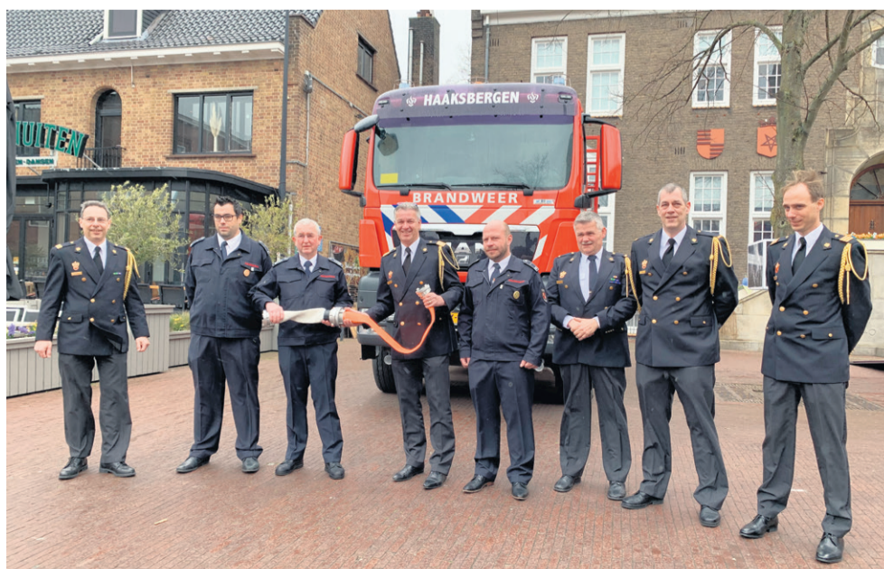
De brandslangen van Ahaus en Haaksbergen passen perfect op elkaar