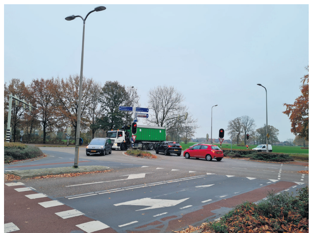
De kruising met de Wiedenbroeksingel verandert in een rotonde.

Over de inrichting van de weg hebben medewerkers van de gemeente al met wijkraden, aanwonenden en andere inwoners gesproken tijdens informatieavonden, vergaderingen en via persoonlijke contacten. Ook was het mogelijk om via oude-n18.nl te reageren op de voorstellen. Op donderdag 19 mei hebben aanwonenden en leden van de wijkraad te mogelijkheid om zich te informeren over de ontwerpen. Ze kunnen binnenlopen tijdens de inloopbijeenkomst in het voormalige kinderdagverblijf aan de Bartokstraat 19 tussen 16.00 en 20.00 uur. Wie alvast een indruk wil krijgen van de aanpassingen kan kijken op oude-n18.nl . De aanpassingen aan de oude N18 worden mede mogelijk gemaakt door een financiële bijdrage van de provincie.