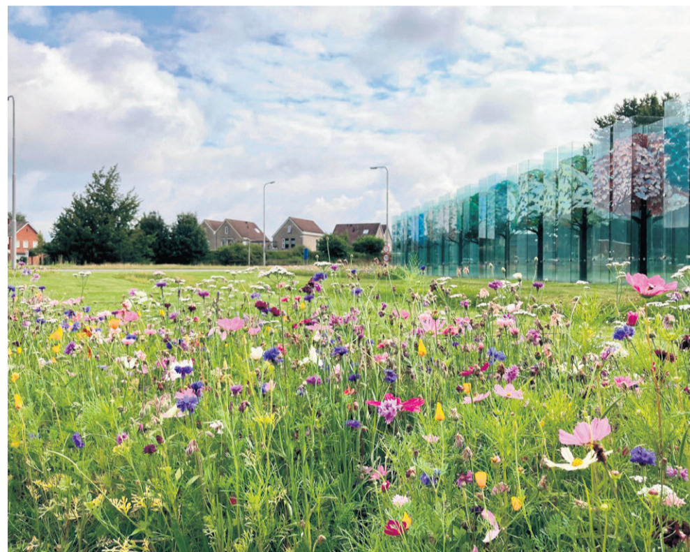
Over een paar weken staat Haaksbergen weer in bloei.

Het maaien en zaaïen doet Twente Milieu in opdracht van de gemeente. Vrijwilligers van de diverse natuurorganisaties in Haaksbergen dragen ook bij. Dat doen ze door het inzaaien van bloemzaden in bermen langs wegen in het buitengebied. Ook inwoners kunnen de dieren een handje helpen met een bloemrijke tuin. Bewoners van het buitengebied vragen we om de bermen voor hun huis niet te maaien. Zo helpen we allemaal een handje mee!