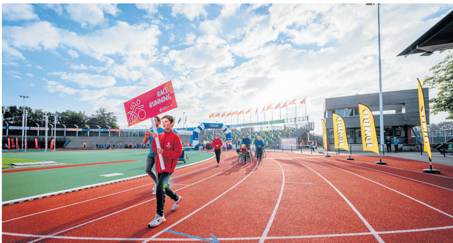
Ambassadeur Teun tijdens de Pre-games 2021

Samen zorgen wij in Twente voor een zo groot mogelijk sportpodium voor G-sporters. Door Noaberschap, samenwerken