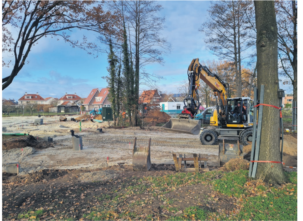
De ondergrondse werkzaamheden zijn bijna afgerond. De volgende fase is het aanleggen van de rotonde.

het daadwerkelijk aanleggen van de rotonde. Gestart wordt met het aanbrengen van puinverharding en het opbouwen van de weg met onder andere trottoirbanden. Daarna kan er geasfalteerd worden en kan het middeneiland op de rotonde gerealiseerd worden. Het planten van openbaar groen kan na opening van de rotonde plaatsvinden. Of de aannemer de komende weken onafgebroken kan doorwerken is onzeker. De weersomstandigheden hebben daar invloed op. Als het bijvoorbeeld vriest, ook al is het maar een paar graden onder nul, dan kan geen asfalt en beton aangebracht worden. Bij gunstige weersomstandigheden is de rotonde op zijn vroegst eind januari klaar. De planning voor de komende weken is echter in deze wintermaanden niet glashard.