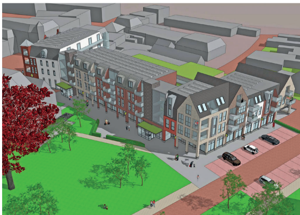
Een openbaar park maakt onderdeel uit van het Marktplan.