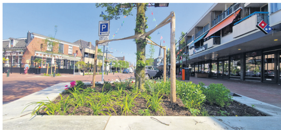
In het Haaksbergse dorpshart is vorig jaar ook het nodige gebeurd. Zichtbaar is natuurlijk de herinrichting van de Molenstraat.

Heeft de gemeente dan nu de wind in de zeilen als het gaat om de financiën? "Daar is zeker geen sprake van", waarschuwt wethouder Niemans. "Het is belangrijk dat we ons niet blind staren op de mooie cijfers over 2022. Beter is om te kijken naar het geld dat we de komende jaren jaarlijks ontvangen en gaan uitgeven. Op de keper beschouwd zijn onze reserves nog steeds niet om over naar huis te schrijven. Dat heeft gevolgen. We hebben al jaren moeite om onze voorzieningen overeind te houden. Deze voorzieningen hebben een enorme impact op de structurele bestedingsruimte van de gemeente. Wanneer we blijven doen wat we altijd deden - veel geld uitgeven voor een hoog voorzieningenniveau -, dan is dat niet goed voor de financiële stabiliteit van de gemeente. Tegelijkertijd krijg je ook een afkalving van al deze voorzieningen wanneer geen keuzes gemaakt worden en we er telkens met de kaasschaaf langs moeten."