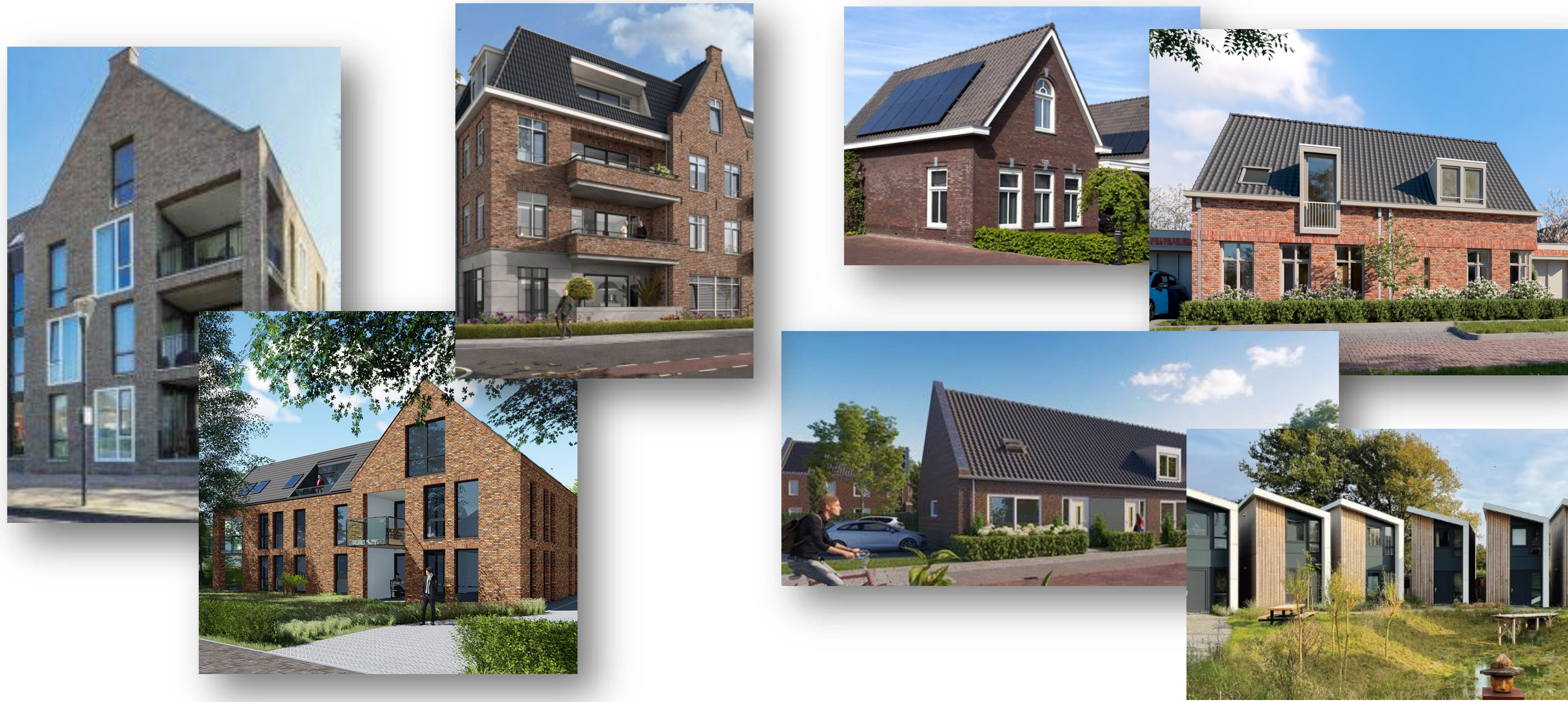
1. Maatschap De Els