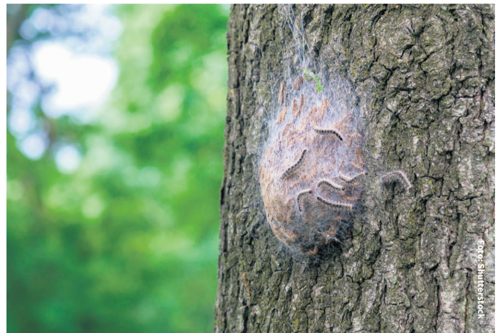
Nu het 's avonds en 's nachts minder koud is, begint de bestrijding van de eikenprocessierupsen.

De kans op nesten met rupsen is dus kleiner door de preventieve aanpak. Bovendien worden eiken regelmatig gecontroleerd. Maar u kunt zelf ook de aanwezigheid van