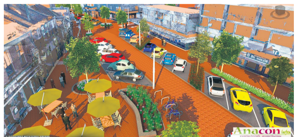
De Molenstraat vanaf de kant van de Eibergsestraat.

De gemeente wil het Haaksbergse dorps hart graag aantrekkelijker maken voor bezoekers en bewoners. Daarvoor is samen met centrumondernemers en met steun van de provincie Overijssel het Actieplan Centrum opgesteld. Stapje voor stapje worden er verbeteringen aangebracht in het centrum die de sfeer ten goede komen. Onderdeel daarvan is de reconstructie van de Molenstraat. Bij de herinrichting van deze straat is goed gekeken naar ontwikkelingen met betrekking tot het klimaat, duurzaamheid en toekomstbestendigheid.