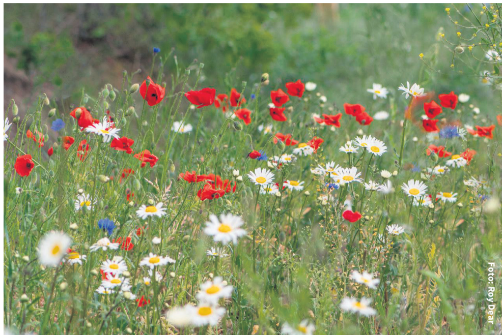
Door bloemen en kruiden krijgen insecten een betere leefomgeving.

De gemeente Haaksbergen streeft de komende jaren naar meer biodiversiteit. Niet alleen in het buitengebied, maar met name ook binnen de bebouwde kom. Oftewel, meer bloemen, bijen, vlinders en andere insecten. Want het gaat in Nederland niet zo goed met de insecten, terwijl ze juist zo belangrijk zijn voor de natuur. Om de bloemetjes en bijtjes een beetje te helpen, zijn en worden er bloemzaden ingezaaid én wordt er minder en anders gemaaid.