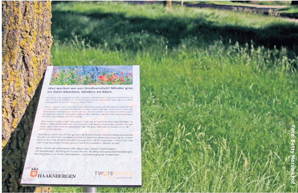
Op ongeveer 25 procent van de gazons krijgen kruiden en bloemen de ruimte. Op de borden is nader uitleg te lezen.

De gemeente werkt de komende jaren binnen en buiten de bebouwde kom aan meer biodiversiteit in de openbare ruimte. Veel planten en ander groen hebben de afgelopen zomers te lijden gehad onder onder andere de droogte, waardoor de leefomgeving van insecten wordt bedreigd. Die insecten zijn juist zo belangrijk voor de natuur: voor gewassenbestuiving, als voedsel voor andere dieren en als natuurlijke vijand van de eikenprocessierups. Daarom krijgen kruiden en bloemen meer ruimte, zodat er een betere leefomgeving voor insecten ontstaat en de natuur meer tot bloei komt.