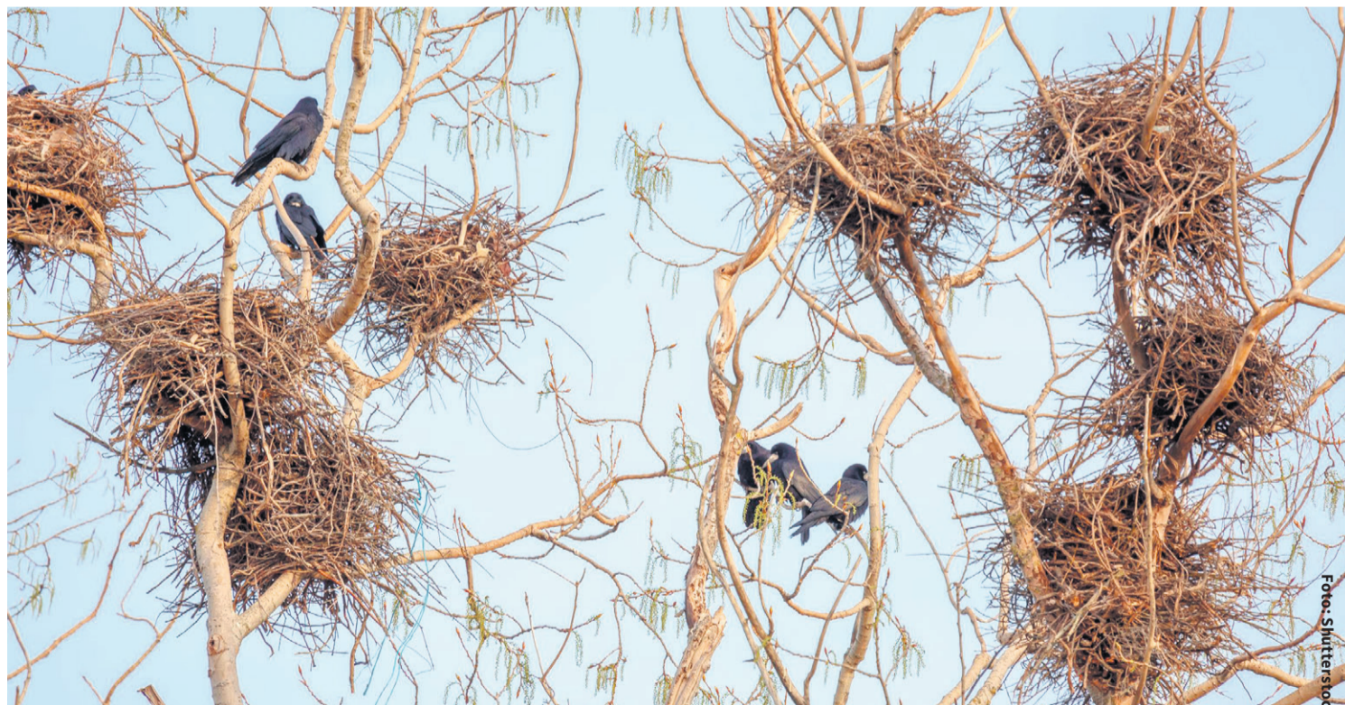
Roeken zijn beschermde vogels. Ze mogen niet worden gedood of verjaagd.

Maar sommige dingen lossen zich ook vanzelf op! Rond deze tijd neemt de geluidsoverlast af, omdat jonge roeken hun nesten nu verlaten. In het verleden kwamen roekenkolonies vooral in ons buiten-