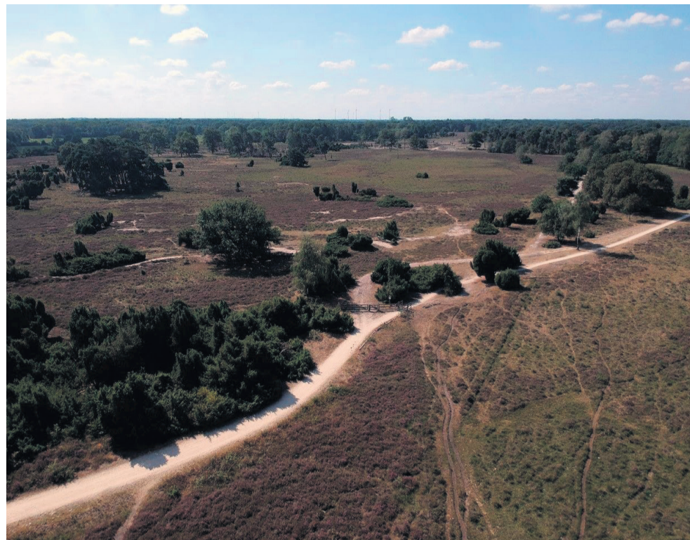
Vanaf begin juli vinden er voor ingrijpende maatregelen plaats in het Buurserzand en Horsterveen in het kader van Natura 2000.

Bij de totstandkoming van de plannen voor natuurherstel is de afgelopen jaren uitgebreid overleg geweest met omwonenden, partners in het gebied (zoals LTO en de waterschappen) en deskundigen. Er is daarbij rekening gehouden met de per-