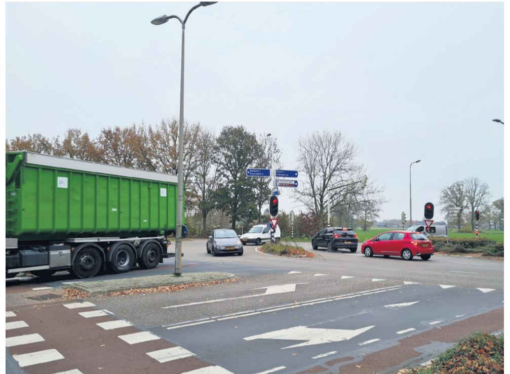
De gemeente werkt aan een nieuw ontwerp van de oude N18. Daarbij wordt ook gekeken naar de veiligheid van kruispunten.

de kruispunten is nog niet gemaakt. De gemeenteraad kan de komende tijd nog wensen en bedenkingen aangeven. Over het aanpassen van de kruisingen van de oude N18 met de Wiedenbroeksingel en de Morsinkhofweg heeft de gemeente al veel gesproken met inwoners, maar over het verwijderen van het Wilhelminaviaduct nog niet. Daarom volgen nu gesprekken