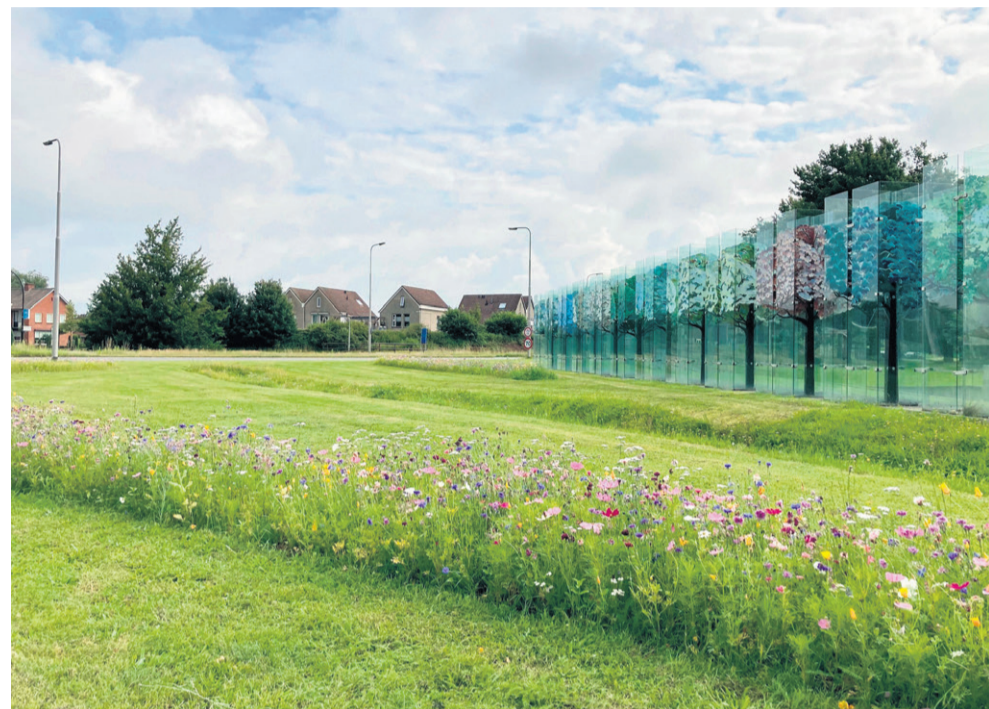
De oude N18 wordt verder aangepast. Er wordt begonnen met het wegdeel tussen het markante Glazen Bos en de Morsinkhofweg.

Over de inrichting van de weg hebben medewerkers van de gemeente veel met wijkraden, aanwonenden en andere inwoners gesproken tijdens informatieavonden, vergaderingen en via persoonlijke contacten. De plannen zijn hierdoor in de loop van de tijd nog wat aangepast. Buurtbewoners ontvangen schriftelijk bericht over de op handen zijnde werkzaamheden.