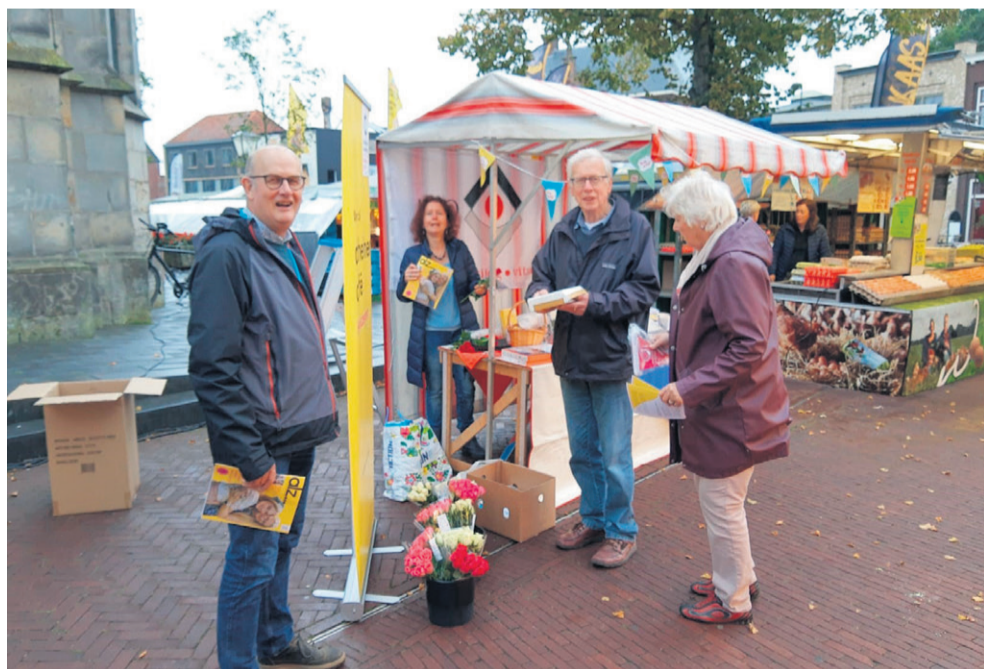
Net zoals vorig jaar staan ook dit jaar de organisaties gezamenlijk op de weekmarkt.

Volgende week is in Haaksbergen de Week van de Ontmoeting. Verschillende organisaties en vrijwilligers organiseren leuke activiteiten waar mensen nieuwe sociale contacten op kunnen doen én bestaande contacten kunnen versterken. Van woensdag 28 september tot en met vrijdag 7 oktober zijn er verschillende activiteiten. Het programma kunt u hieronder vinden. U komt toch ook?