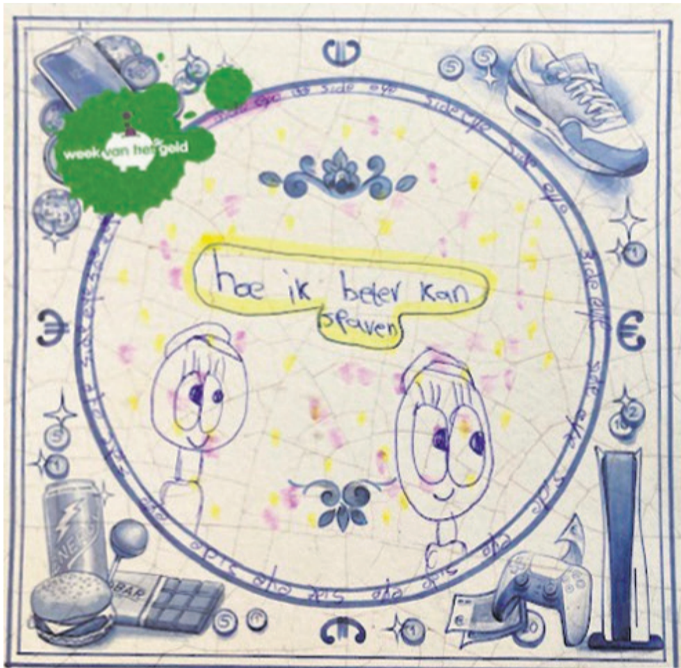
Aan het eind van de gastlessen konden de leerlingen aangeven op een 'tegeltje' wat zij hebben geleerd van de les.

geven van gastlessen hopen wij ze te helpen aan een toekomst zonder geldzorgen en te leren dat ze op tijd om hulp en advies vragen als wel geldzorgen zijn." Hiervoor kunnen ze terecht bij de gemeente. "Daarom vertellen we tijdens de gastlessen ook meer over ons werk en hoe we mensen kunnen helpen met geldzorgen. Zo leren kinderen en jongeren niet alleen verstandig omgaan met geld, maar weten ze ook waar ze terecht kunnen als ze hulp nodig hebben", aldus Annie.