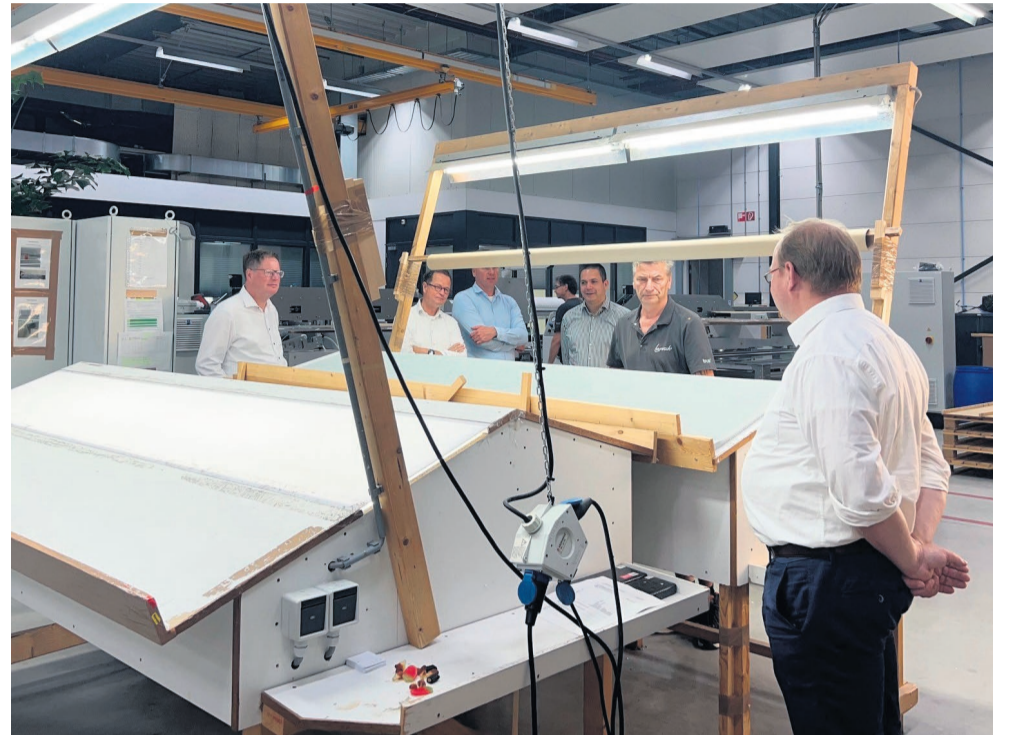
Natuurlijk hoorde een uitgebreide rondleiding door de fabriek bij het werkbezoek van B&W aan Lienesch.