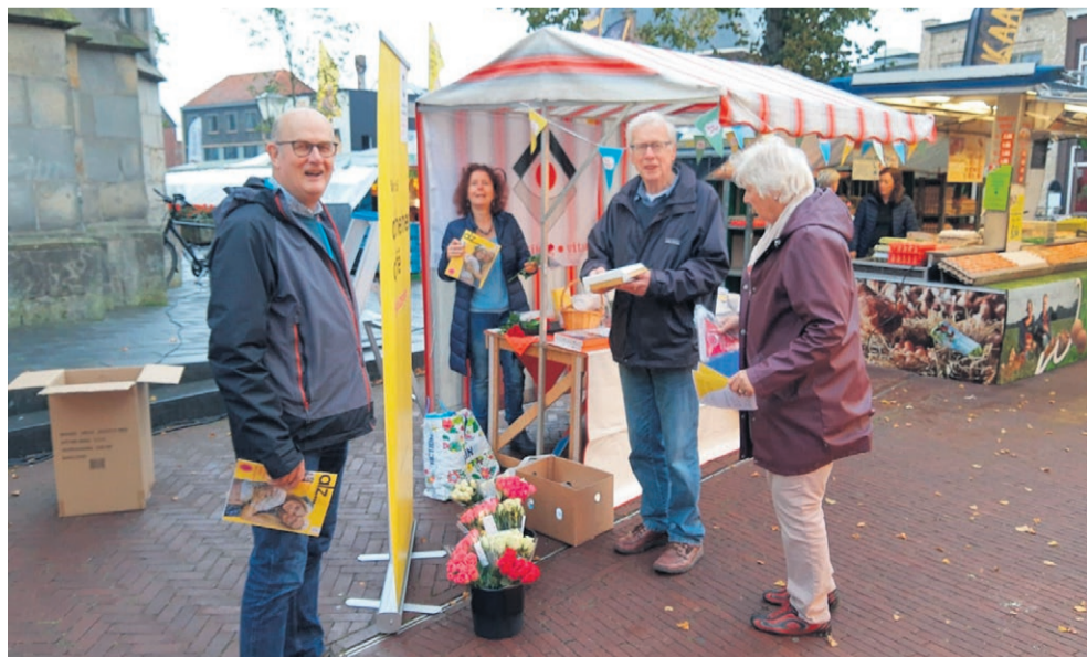
Op woensdag 27 september staan de organisaties gezamenlijk, van 9.00 uur tot 12.30 uur, op de weekmarkt.

Volgende week is in Haaksbergen de Week van de Ontmoeting. Verschillende organisaties en vrijwilligers organiseren leuke activiteiten waar mensen nieuwe sociale contacten op kunnen doen én bestaande contacten kunnen versterken. Van woensdag 27 september tot en met vrijdag 6 oktober zijn er verschillende activiteiten voor jong en oud.