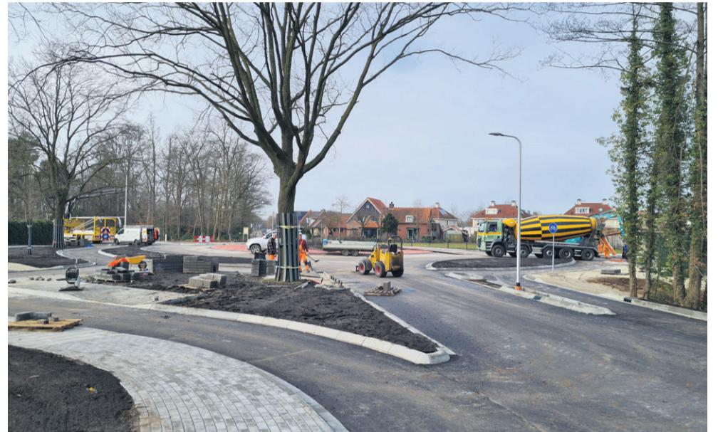
Vanaf maandag 13 februari is Haaksbergen beter bereikbaar.

Voor de oude N18 geldt bijna hetzelfde verhaal. Het deel waaraan de laatste maanden is gewerkt, is vanaf maandag de dertiende weer open en gaat dit voorjaar voor eenzelfde periode weer even dicht. De laatste afwerking wordt gecombineerd met de asfaltering. Het wegdek is nu nog bobbelig. De maximumsnelheid is daarom beperkt tot 30 km per uur. Dit wordt met borden aangegeven. Ook hier komen tijdelijke wegmarkeringen. Later dit jaar starten de werkzaamheden op een ander deel van de oude N18, namelijk het deel vanaf de Smiterijweg tot het Grintenbosch.