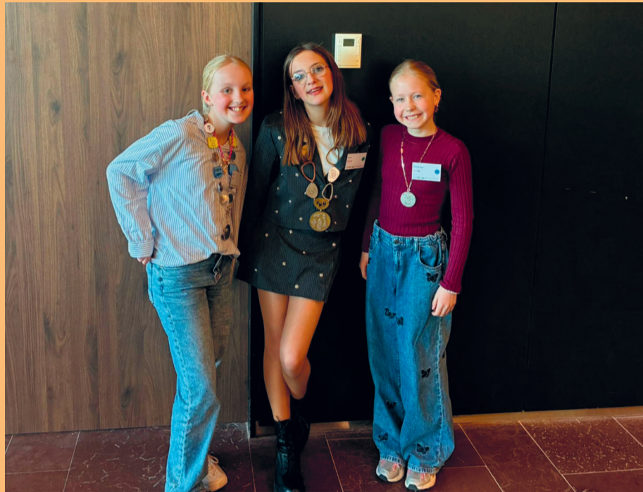
Hier sta ik (rechts) samen met de kinderburgemeester van Losser en de kinderburgemeester van Borne op. De enige kinderburgemeesters uit Twente!

Ik heb veel geleerd en vond het erg gezellig.