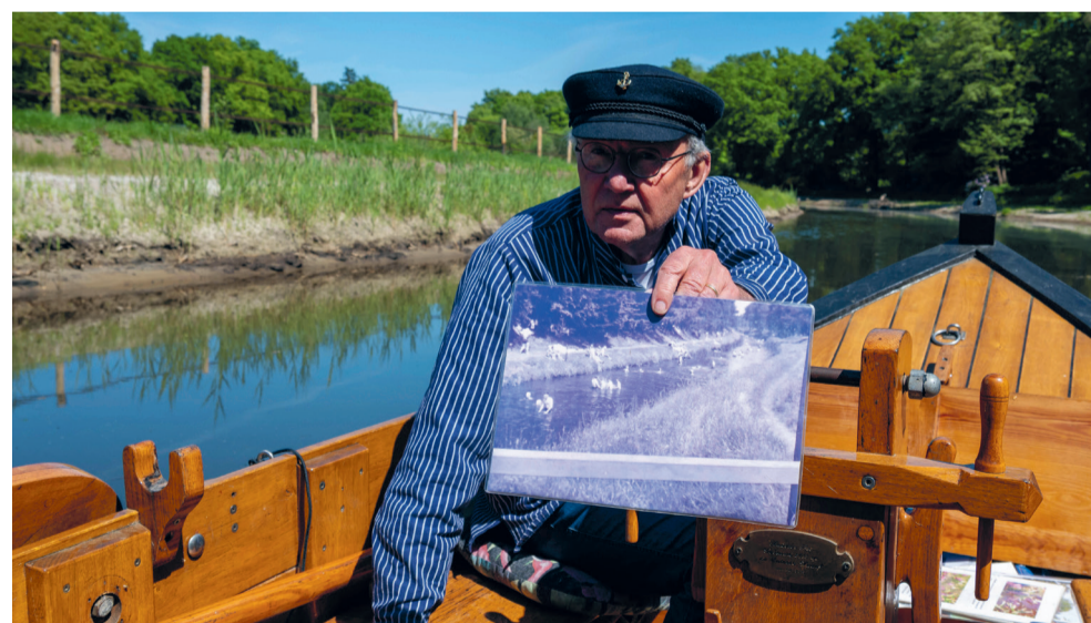
Tijdens de Twentse Waterweken zijn er verschillende activiteiten op en rond het water. Ook in Haaksbergen. Vaar mee met de Buurser Pot, volg een rondleiding op landgoed Het Lankheet of stap op de fiets voor een fietstocht door het Witte Veen.

Meer informatie over alle activiteiten en het volledige programma van de Twentse Waterweken is te vinden op groenblauwtwente.nl/waterweken .