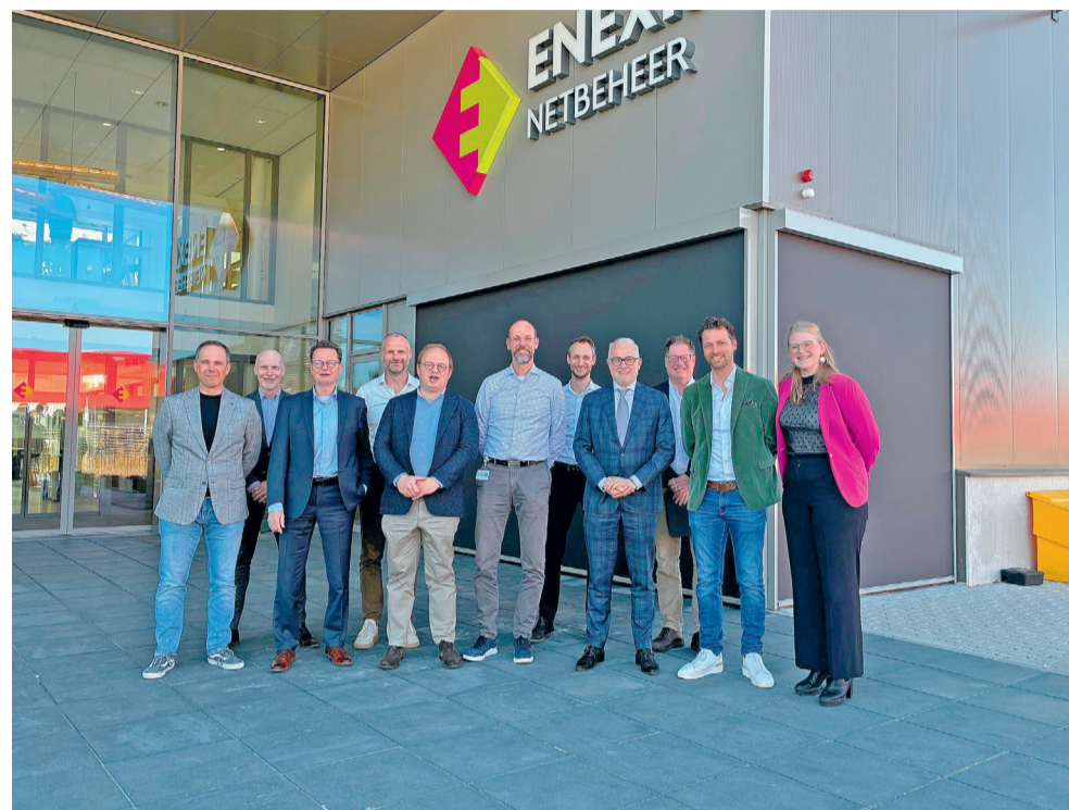
Het college van B&W, enkele Haaksbergse ambtenaren en medewerkers van Enexis voor het bedrijf in Hengelo.

De provincie Overijssel neemt ook maatregelen. Deze week werd bekend dat elektrische auto's bij openbare laadpalen tijdens piekuren minder snel opladen, om maar een voorbeeld te noemen. Daarnaast oriënteren gemeenten, waaronder Haaksbergen, zich op wat zij kunnen doen. Gedacht wordt aan onder meer energieopslag of het verdelen van energie tussen bedrijven. Op het verzwaren van het netwerk heeft de gemeente echter geen invloed. De gemeente en Enexis ondertekenden tijdens het werkbezoek een overeenkomst om de nauwe samenwerking van de komende jaren te bevestigen. Dat houdt onder meer in dat er afstemming is over de werkzaamheden in Haaksbergse wijken en de communicatie daarover.