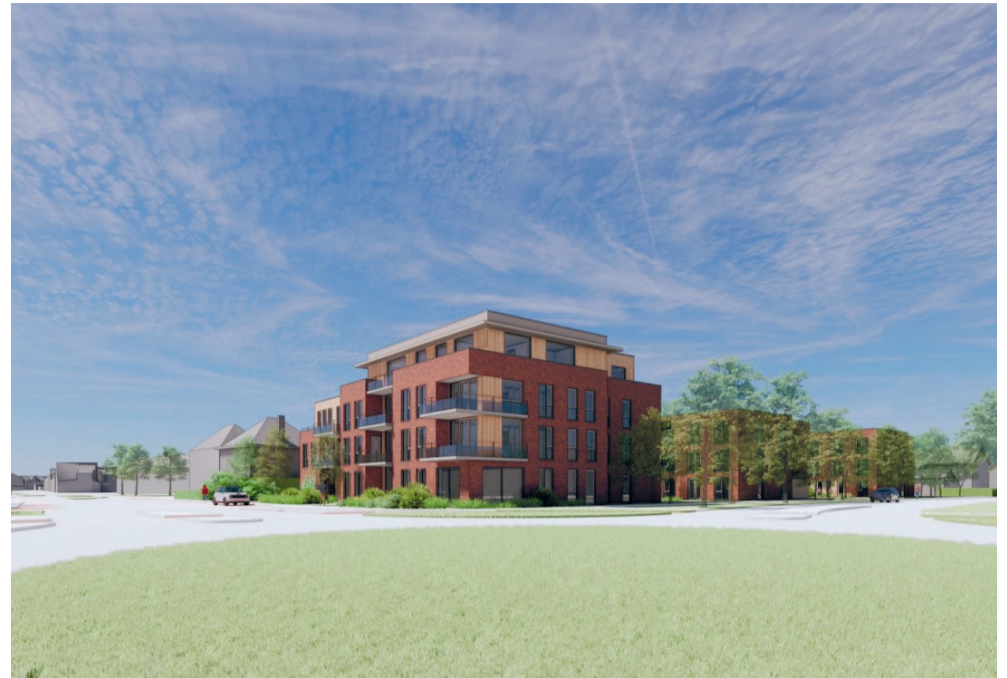
Op de voorgrond één van de drie appartementencomplexen.

drie appartementencomplexen, waarbij aan de achter- en zijkant geparkeerd wordt. Rondom de gebouwen komt openbaar groen en een waterberging. Bewoners kunnen hun huizen via de Albert Cuyplaan bereiken en aan de Goorsestraat komt een nooduitgang. Drie partijen werken samen aan de totstandkoming van de woningbouw, namelijk Raedthuys Vastgoed, Hagemeyer Vastgoed en Koopmans Projecten. Burgemeester en wethouders vragen de gemeenteraad om tijdens de komende raadsvergadering akkoord te gaan met het plan.