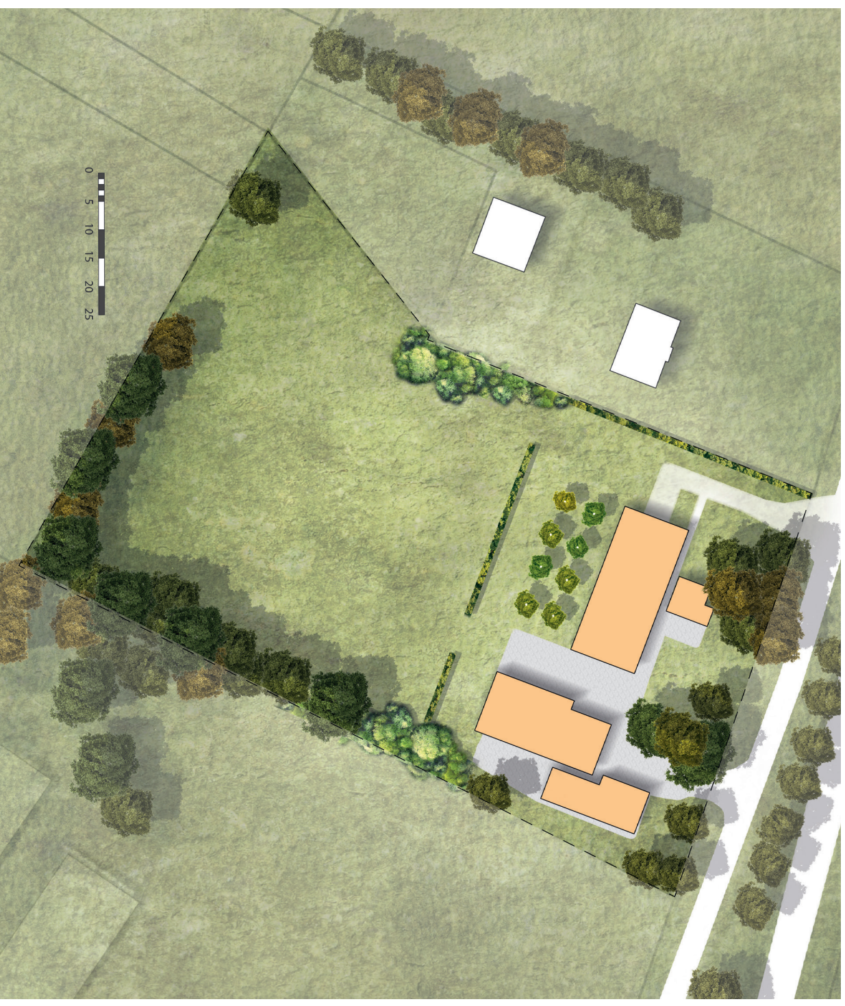
Nieuwe situatie erf Goorsestraat 243