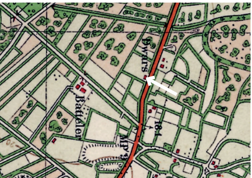
Erflocatie omstreeks 1930 in een kleinschalig cultuurlandschap

Nadat de agrarische bedrijfsactiviteiten zijn beëindigd wordt er op het erf aan de Goorsestraat 243 een oppervlakte van 1.400m 2 aan schuren gesloopt en zal daarnaast het oppervlak aan erfverharding afnemen.