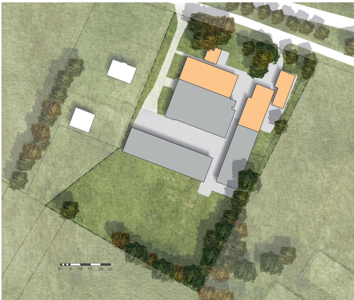
Huidige situatie erf Goorsestraat 243

Nadat de agrarische bedrijfsactiviteiten zijn beëindigd wordt er op het erf aan de Goorsestraat 243 een oppervlakte van 1.400m 2 aan schuren gesloopt en zal daarnaast het oppervlak aan erfverharding afnemen.