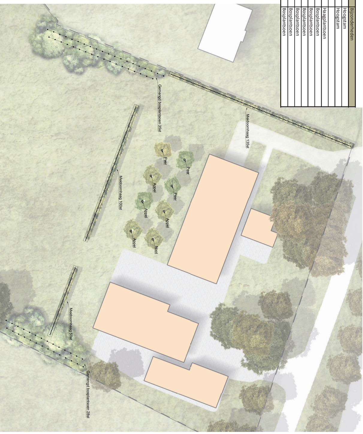
Nieuwe aanplant Goorsestraat 243

Het erf krijgt een optische begrenzing met een landelijke meidoornhaag die wild en breed mag uitgroeien. Het haagplantsoen wordt in rij aangeplant met drie stuks per strekkende meter.