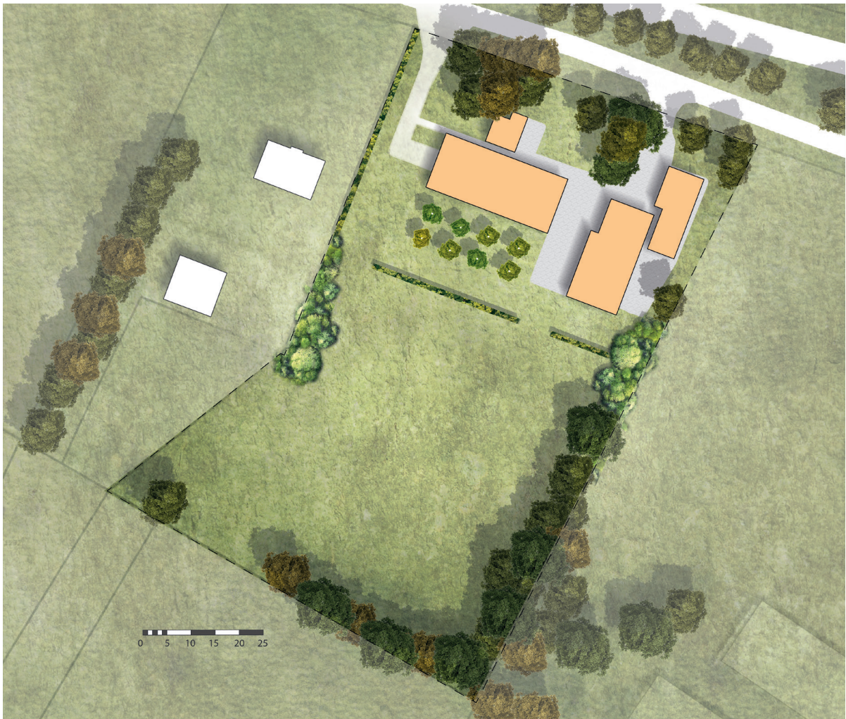
Nieuwe situatie erf Goorsestraat 243

Onderstaande afbeelding schetst het erf in de nieuwe situatie. 1400 m 2 aan schuuroppervlak is verwijderd en ook het oppervlak aan erfverharding neemt af. Het afgeslankte erf wordt landschappelijk aangezet met groenstructuren. Enerzijds wordt de singelstructuur aangevuld met uitbreiding van de oostelijke singel en een nieuwe, korte singel ten westen van het erf. Deze ligt nagenoeg op de locatie waar omstreeks 1900 een singel heeft gelegen. Verder wordt de zuidkant van het erf aangezet met karakteristieke erfbeplanting. Een hoogstamboomgaardje met acht bomen (appel, noot en peer) onttrekt de schuren vanuit zuidelijk perspectief aan het zicht. Het erf wordt gemarkeerd met een landschappelijke haag langs het westen en het zuiden van de bijgebouwen.