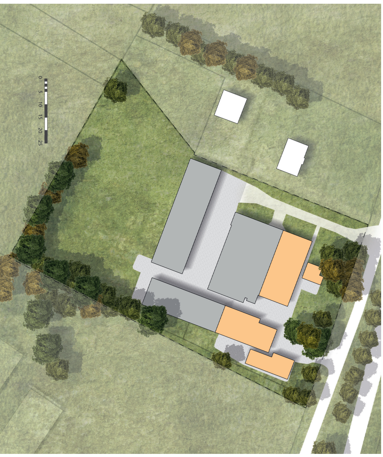
Huidige situatie erf Goorsestraat 243